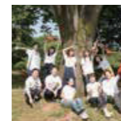
NPO 法人いろはリズム(音楽団体)

音楽大学出身のプロの演奏家による音楽団体。 音楽公演/ワークショップの企画、学校等での アウトリーチなどを行っています。