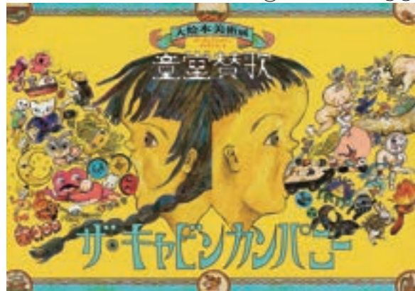
ザ・キャビンカンパニー「童堂賛歌メインビジュアル」2024年

ザ・キャビンカンパニー 大絵本美術展 〈童堂賛歌〉 2024年11/16(土) - 2025年1/13(月・祝)