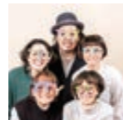
TOITOY (てつがくワークショップ)

「問いをあそび、おもしろがる」TOITOYは、いつもみんなの隣にある「なんで？」を、対話を楽しみながらじっくり自由に考えるワークショップです。