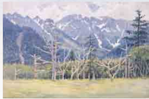
《穂高山の残雪》1907(明治40年) 島根県立石見美術館蔵

とになった。それらと比較して気付かされることは、大下の早すぎる晩年に制作された作品群には、構図や色づかい、筆致の点で昭和期に制作されたと言っても通用するような作例があることだ。大下は、後に続く画家たちが紆余曲折のすえに見出した地点にたったひとりで立っている。