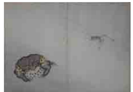
(図3) 森春溪/画『春溪画譜』一帖 文政3年(1820) 千葉市美術館ラヴィッツ・コレクション