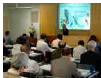
「生涯学習アカデミーちば」講義の様子