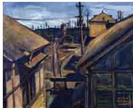
無縁寺心澄《機関庫の昼》 1930(昭和5)年 千葉市美術館蔵