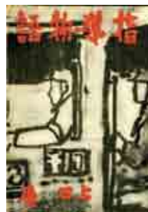
上田廣『指導物語』装幀：無縁寺心澄 大観堂書店 1940(昭和15)年