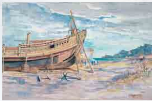
《館山》1896(明治29年) 島根県立石見美術館蔵