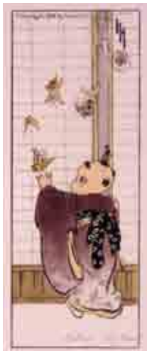
(図1) ヘレン・ハイド《Butterflies》 木版多色摺 明治41年(1908) 千葉市美術館蔵