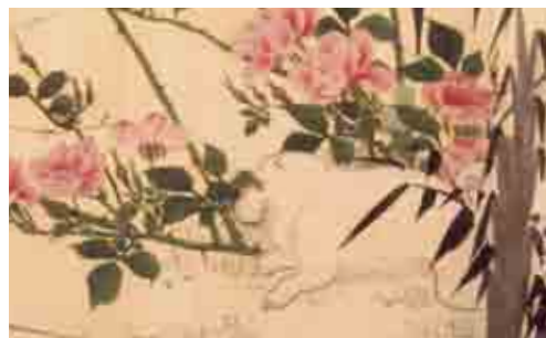
(図2) 長澤蘆雪《花鳥蟲獸図巻》一巻(部分) 寛政7年(1795) 千葉市美術館蔵