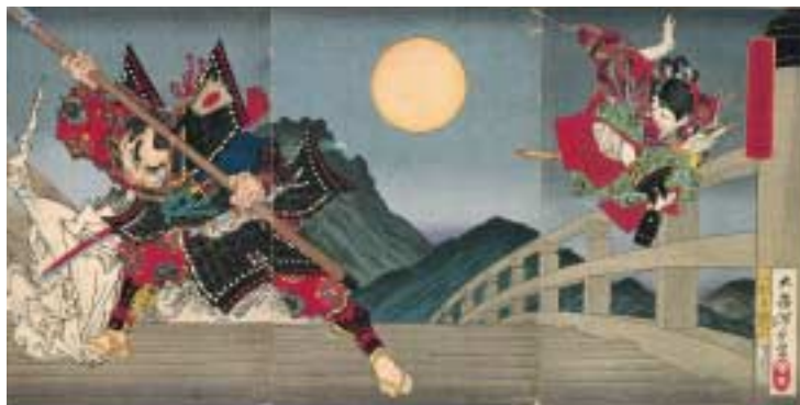
大蘇芳年 義経記五条橋之図 くもん子ども研究所蔵