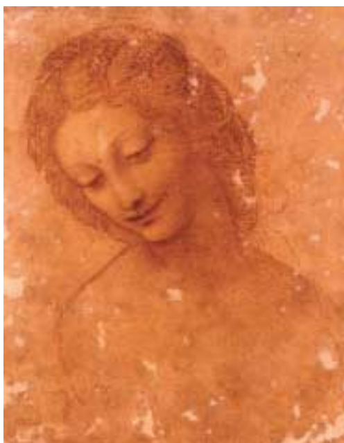
レオナルド・ダ・ヴィンチ レダの頭部 15世紀 スフォルツァ城博物館