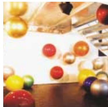
ウーゴ・ロンディノーネ サンタ・フェ 2001年

スイス人アーティストの作品を通して、観光地というイメージの裏側にある現実のスイスの一端を紹介する展覧会です。インスタレーション、ビデオアート、写真を中心に、現在国際的に注目を集めているアーティストたちの作品を厳選して紹介します。なお本展は、ダイナミック・スイス(日本におけるスイス年)関連企画のひとつです。