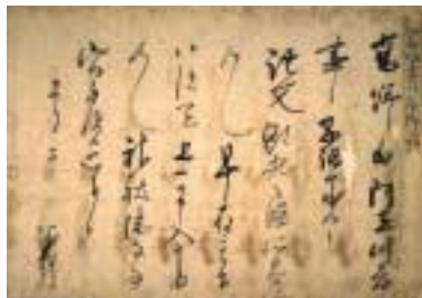
国宝 源義経自筆書状 宝簡集所収 平安時代(寿永3年・1184) 金剛峯寺蔵

第二章は「平家一門の栄華」。平治の乱(1159)以後、「平家にあらずんば人にあらず」と豪語するまでに至った平家一門の絶頂期、平清盛は厳島神社を造営し華麗な「平家納経」を奉納しました。一門がその栄華を背景として文化面で果たした貢献を、遺された宝物に