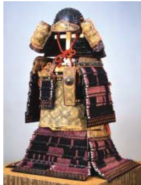
国宝 紺糸威鎧兜・大袖付（伝平重盛所用） 広島・厳島神社蔵

を訪れてくださったお一人お一人のご支援の賜物に違いありません。学芸員や私の耳元まで届いてくる皆様の励ましや叱正のお声に、どれほど勇気づけられてきたか、計り知れないものがあります。またボランティアの皆様によるギャラリートークほかの様々な活動、学校の先生方や生徒諸君との親しい連携も年を追うごとに高まり、深まってきました。私が当館に招かれてから7年目になりますが、ますます確かな手応えを実感させられているこの頃です。