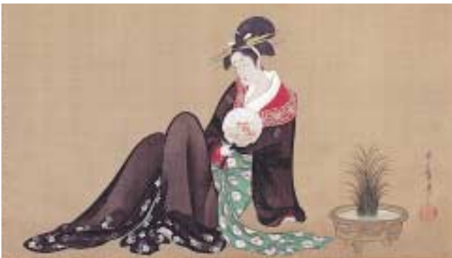
喜多川歌麿 納涼美人図 寛政(1789-1801)中期 当館蔵

天明・寛政期(1781-1801)は、浮世絵の黄金期ともいわれてきました。この時期には鳥居清長、東洲斎写楽、喜多川歌麿といった優れた浮世絵師たちが活躍し、華やかで豊かな表現が展開されます。この時期の浮世絵の全貌と魅力をお楽しみいただけます。