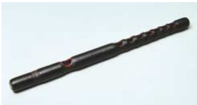
龍笛 銘 薄墨 (伝源義経所用) 鎌倉時代 鉄舟寺蔵