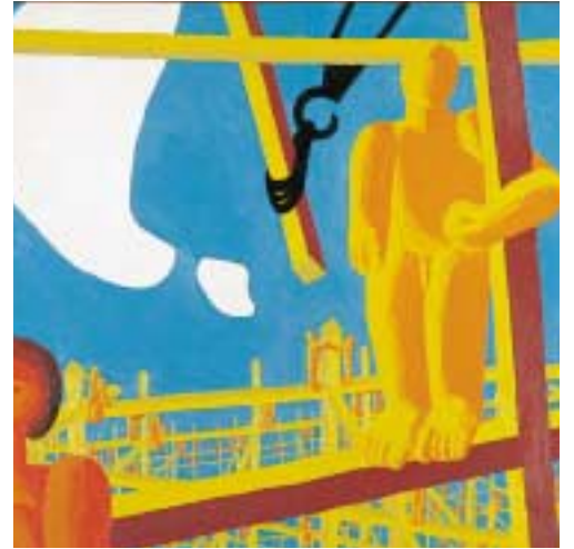
鎌囃 若い仲間たち 1955年 当館蔵