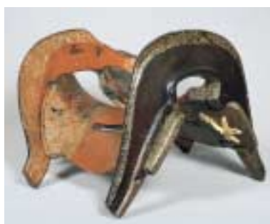
重要文化財 海松円文螺鈿鞍轡(伝源頼朝所用) 平安時代 奈良・手向山八幡宮蔵

見てゆきます。名高い国宝「平家納経」は、清盛が一門の繁栄を祈り発願し、長寛2年(1164)に奉納した三十三巻の経巻で、本展では前期(4月5日～24日)に「信解品第四」を、後期(4月26日～5月15日)に「如来神力品第二十一」を展示します。同じく厳島神社蔵の国宝「紺糸威鎧」(4月5日～17日展示)は、平重盛所用の鎧として古くから知られていたものです。兜も含め全体が揃い当初の面影をよくとどめた大鎧で、当時の工芸技術の粋を結集して作られたその重厚さには改めて圧倒されます。