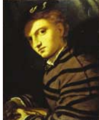
ロット 若者の肖像 スフォルツァ城博物館蔵

ミラノ市の全面協力を得てブレラ美術館などミラノに所在する美術館・博物館からの出品作品で構成されます。ローマ帝国時代の初期キリスト教美術から、レオナルド・ダ・ヴィンチ、ブラマンティーノなどのルネサンスの名品、モランディ、セガンティーニといった近現代美術まで約70点によりミラノの歴史・文化・芸術の魅力を紹介します。