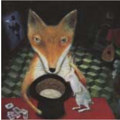
出久根育『あめふらし』より 2001年 ©出久根育

スロヴァキアの首都ブラティスラヴァで2年に一度開催される国際絵本原画展の第19回展(2003年秋開催)より、受賞作品と日本人作家の作品を中心に紹介します。また、面白い素材や技法を用いた原画にも注目し、絵本だけにとどまらず、絵画や立体、オブジェなど、豊かに広がってゆく歴代受賞作家たちの楽しい造形世界もあわせて紹介します。