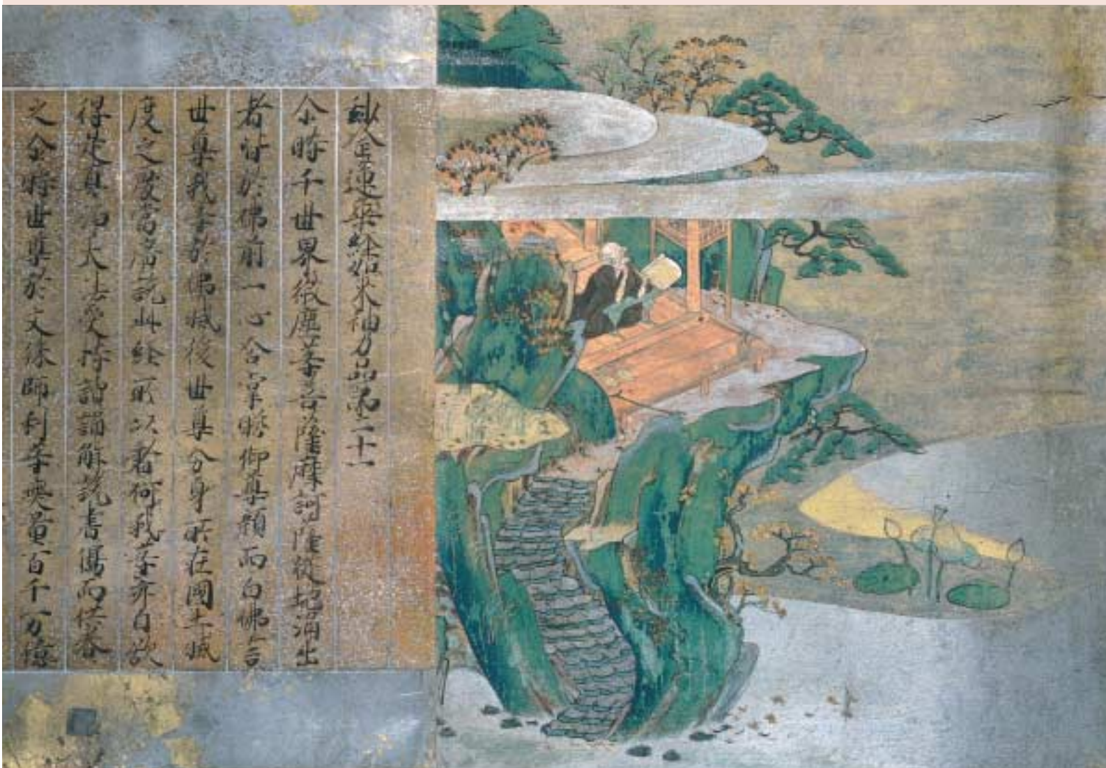
国宝平家納経のうち「法華經如來神力品第二十一」 広島・厳島神社蔵 [4月26日～5月15日展示]