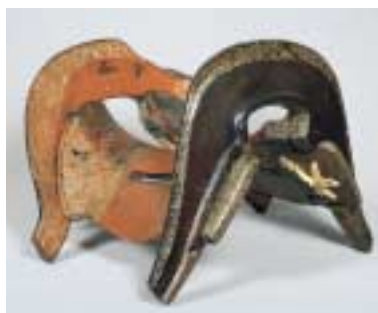
重要文化財 海松円文螺鈿鞍 (伝源頼朝所用) 平安時代 奈良・手向山八幡宮蔵

見てゆきます。名高い国宝「平家納経」は、清盛が一門の繁栄を祈り発願し、長寛2年(1164)に奉納した三十三巻の経巻で、本展では前期(4月5日～24日)に「信解品第四」を、後期(4月26日～5月15日)に「如来神力品第二十一」を展示します。同じく厳島神社蔵の国宝「紺糸威鎧」(4月5日～17日展示)は、平重盛所用の鎧として古くから知られていたものです。兜も含め全体が揃い当初の面影をよくとどめた大鎧で、当時の工芸技術の粋を結集して作られたその重厚さには改めて圧倒されます。