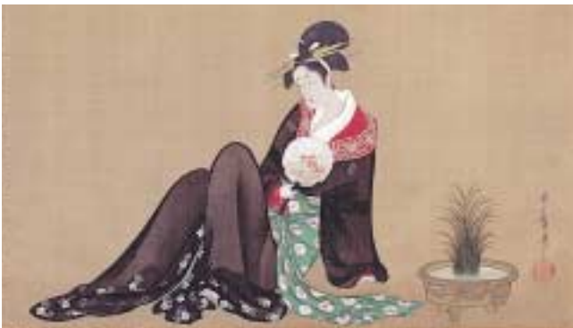
喜多川歌麿 納涼美人図 寛政(1789-1801)中期 当館蔵

天明・寛政期(1781-1801)は、浮世絵の黄金期ともいわれてきました。この時期には鳥居清長、東洲斎写楽、喜多川歌麿といった優れた浮世絵師たちが活躍し、華やかで豊かな表現が展開されます。この時期の浮世絵の全貌と魅力をお楽しみいただけます。