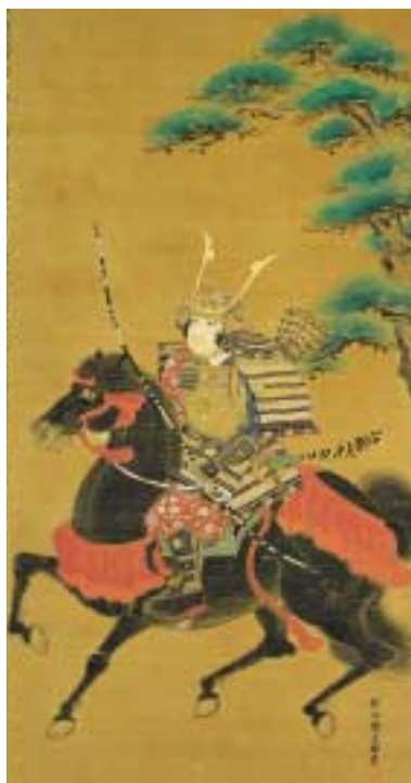
狩野探幽筆 義経図(牟礼高松図) 江戸時代 茨城県立歴史館蔵