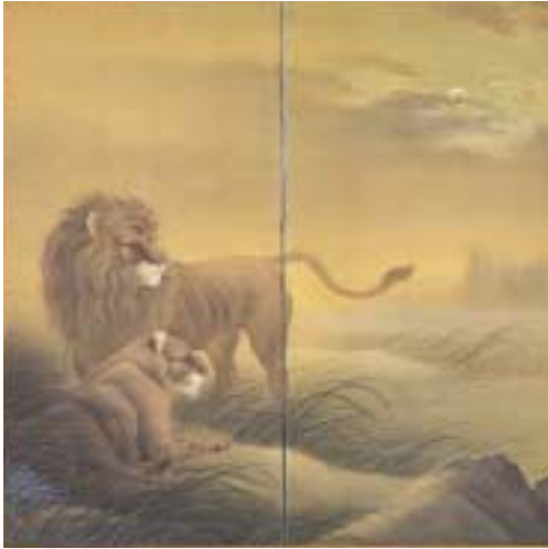
小林清親 獅子図 1884年 当館蔵