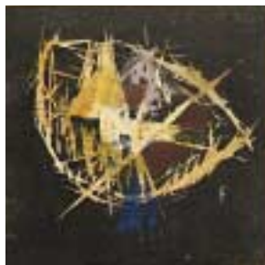
fig.2 藤牧義夫『新版画』12号より《月》 1934年 神奈川県立近代美術館蔵

30年代にはベテランたちもそれぞれに表現を深め、個性に磨きをかけましたが、その代表格といえばやはり恩地孝四郎でしょう。恩地にとっての30年代は、単なる「版画」を超えたさまざまな試みをなした模索の季節でした。音楽に題材を求め、飛行という体感を造形し、はたまた版画と写真、活字をひとつの画面に構成する(fig.3)。それらは今なお斬新で刺激的な作品です。