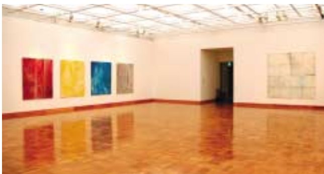
「モノクローム絵画の魅力」展会場風景 (左：小林正人 右：吉永裕)