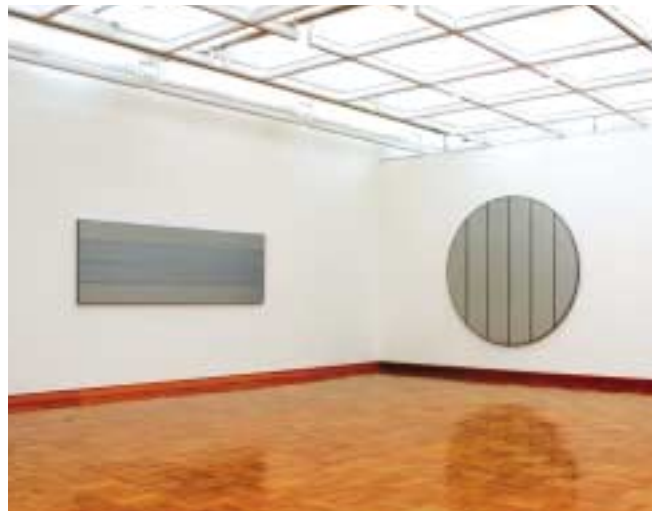
「モノクローム絵画の魅力」展会場風景 (桑山忠明)

桑山忠明は、シルバーをはじめとするモノクロームのメタリック・カラーを用いて作品を制作します。このニュートラルなメタリック・カラーの絵画は、美術館のニュートラルな白い壁