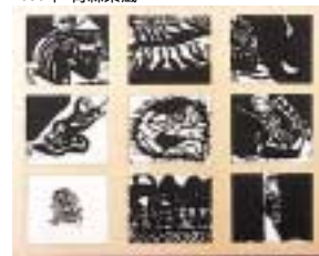
fig.4 棟方志功《勝鬘譜善知鳥版画曼荼羅》 1938年 青森県蔵

この展覧会は、1997年以来当館で開催しておりますシリーズ展「日本の版画」の第4弾でもあります。過去の展示をご覧になり、続編をお待ちのかたがいらっしゃるとすれば、担当としては嬉しい限りです。シリーズ展として見るもよし、独立した展覧会として鑑賞するもよし、たった10年の間に生まれた作品ですが、見所は満載と自負しております。戦争へと傾く時勢のなかで、作家たちがどのような思いで版に向かったのかを想像しつつ見ると、作品との対話はより深まるのではないのでしょうか。