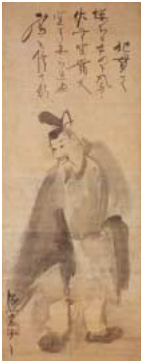
《人麿・貴之像》MOA美術館蔵(重要文化財)