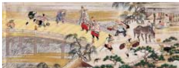
《山中常盤物語絵巻》MOA美術館蔵(重要文化財)

「ただ一点の本物がそこにある」という実在感はなにものにも代え難いとはいえ、展覧会という場では一部分しか見ることができないのが絵巻物の宿命です。しかしこの映画では、各巻12メートル以上、全12巻にわたり延々と繰り広げられるこの絵巻を、余すところなく見ることができます。そもそも「山中常盤」とは浄瑠璃という演劇として上演された話で、絵巻の文字の部分(詞書)もその台本のような形式をとっているものです。そこで、鶴澤清治氏(平成15年度日本芸術院賞の恩賜賞を受賞)が新たに絵巻にあわせて浄瑠璃節を作曲し、はにわオールスターなど多彩な活動でも知られる邦楽囃子の仙波清彦氏が作詞をし、それにのせて、文楽の太夫、豊竹呂勢大夫氏が絵巻詞書を語るのです。(昭和3年の暮れ、この絵巻がドイツ人に買われ海を渡ろうとしていたとき邸を抵当に入れ私財を売り払ってこれを引き留め、その熱情から「又兵衛やつれ」とまでいわれた所蔵家が、かつてそれを企てたらしいことがその後の新聞評から知られますが、さすがに劇化までは実現しなかった様子。)浄瑠璃や義太夫といっても何を言っているのかわからない、と思われるかも知れませんが、そこは絵の分量が膨大なこの絵巻の本領発揮・魅力全開といったかんじで、これが本当に面白く、わくわくして飽きさせません。見終わる頃には名調子がうつつてしまいそうなほどでしたが、皆さんはどのようにご覧になるでしょうか。5回上映の予定ですが、10月31日(日)の初回上映後には、羽田澄子監督と辻惟雄本展監修者の対談の形で、作品について語るイベントも行います。展覧会にあわせて、こちらも是非お見逃しなく、ご来場をお待ちしております。