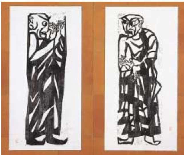
棟方志功《釈迦十大弟子二菩薩》より 1939年 千葉市美術館蔵

これらはいずれも当館で行われてきた特別展のカタログで、20世紀前半の日本近代の版画作品を10年間隔で区切り、毎回300点前後の作品を展示してきたものです。現在は4番目にあげた「棟方志功登場」展が、7階の全フロアを使って開催中です。企画担当の学芸員によれば、あと1回、戦中戦後の1940年代を見渡した展観で所期の全5回展が完結するという事です。10年がかりの、まことに気宇壮大で、しかも一回ごとには緻密に構成されたシリーズ展であり、幸いに目の高い観覧者の方々から好評を得ています。今後おそらくは、これらのカタログをひもとくことなしに、日本近代の版画芸術についてなにがしかを語ることはできなくなることでしょう。