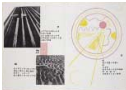
fig.3 恩地孝四郎『飛行官能』より 1934年 千葉市美術館蔵

代表作が並んだ一角で、まず驚かされるのは作品の大きさでしょう。なかでも《東北経鬼門譜》は、版木を120枚使用したという並外れたサイズです。それらの大きさを支える屏風や絵巻といった形式も、彼独特のもので、そしてごつごつと骨太な、墨摺の美しさ。洗練された多色摺を志向する作家が多いなかで、やはり特異といえます。棟方は、当時の版画が優品の数々を生みながらもあまり評価されず、洋画や日本画よりも低い位置にあった状況をよく知っていました。だからまずは型破りな大きさをもって、また木版ならではの黒白の造形をもって、自らをアピールしたのです。そして1938年、《勝鬘譜善知鳥版画曼荼羅》を文展に出品、版画としてはじめての特選を得るといふ快挙をなしました(fig.4)。古事記や生地ゆかりの物語などに取材したことから、ナショナリズムが高揚し、「日本的なもの」を見直す時勢にも後押しされました。30年代は棟方にとって、戦後の「世界のムナカタ」への飛躍を準備した大切な時期といえるでしょう。