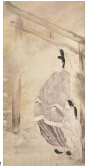
《源氏物語 野々宮図》出光美術館蔵

会場ではまず、又兵衛の特異な画才を誰もが確認できたであろう福井での作品からご紹介します。それは、福井藩主から金屋家に下賜されたと伝えられている「源氏物語」や「龍虎図」など様々な画題を多様な手法を用いて描いた作品群で、明治の末に押絵貼屏風の形から掛軸に改装されて各地に分蔵されるものです。同様に岡山の池田家に伝わり、屏風から掛軸にされたので「旧池田屏風」と呼ばれる作品も四図出品されます。いずれも細密で鋭く緊張感ある線描で人の姿もびりりと引き締まって見事です。これらは、又兵衛の評価故に所蔵家たちの手に分けられ、その名を一層高めてきたわけですが、その改装から約