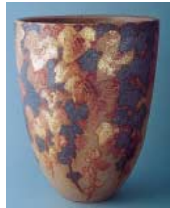
六代清水六兵衛 《古樸彩秋映花瓶》 1972年

江戸期から明治にかけて日本のやきものは、外貨を獲得することのできる数少ない産業でした。加えて、化学的な知識と経験を必要とするために工業への転換が図られたこともあります。事実、現在のファイン・セラミックス企業の創立をたどれば、陶家をその起こりとしている例があります。清水家でも当時の当主だった三代は西洋風のタイルだけではなく、化学工業