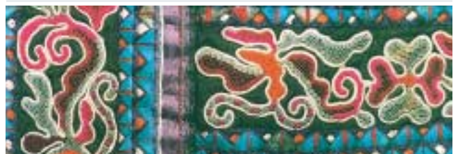
ミャオ族 女性の衣装 部分(刺繍)