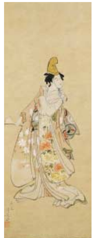
(図3)鳥居清長《三代目瀬川菊之丞の娘道成寺》 天明3(1783)年 財団法人 寺島文化会館蔵