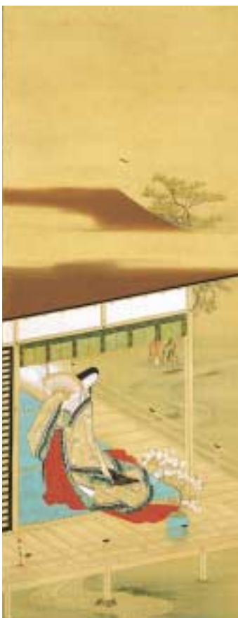
(図2)勝川春章《雪月花 花》 天明(1781-1789)頃 寺島文化会館蔵

龍襦袢の花魁」はゴッホが模写したことで有名な作品です。ゴッホは版画を直接模写したわけではなく、雑誌『バリ・イリュストレ』の表紙に載った図を写したのですが、その表紙の図が裏焼だったため、花魁が逆向きになっています。ゴッホは「タンギー爺さん」(ロダン美術館蔵)の背景に「雲龍襦袢の花魁」を描いた他、「花魁(英泉を模して)」(ファン・ゴッホ美術館蔵)という作品も残しています。