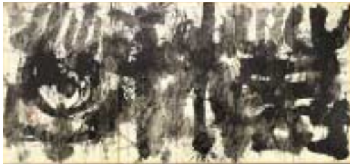
勅使河原蒼風 《萬木千草》1960年 千葉市美術館蔵