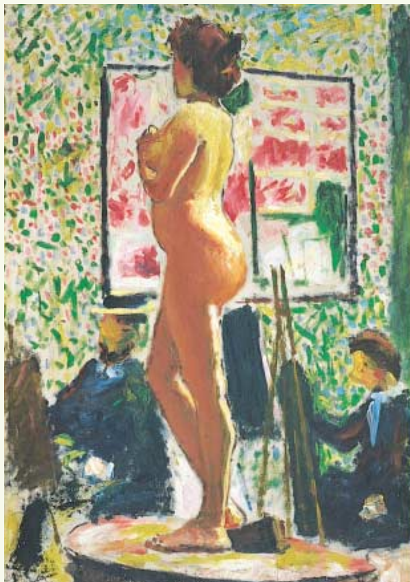
アルベール・マルケ 《裸婦》（通称フォーヴ風裸婦） 1899年 ボルドー美術館蔵