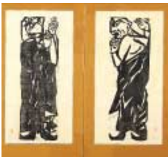
棟方志功《二菩薩釈迦十大弟子》 1939年 千葉市美術館蔵

1930年代、戦争へと傾斜してゆくこの時代に、日本の版画はどのような様相を呈したでしょうか。版木の魂をえぐり出すような作品で衝撃的なデビューを飾った棟方志功、変幻自在なイメージを刻んだ鬼才谷中安規、鋭敏な感性で都市を描いた藤牧義夫などの作品約300点から、それぞれの作家の栄光や苦悩の軌跡をご覧ください。