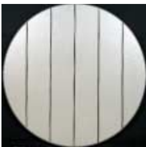
桑山忠明《Silver》 1974年 千葉市美術館蔵

モノクローム絵画。単一の色彩が塗られているだけで何も描かれていない極めてシンプルな絵画です。一見すると無表情なモノクローム絵画は、実は非常に繊細かつ静謐で、独特の美しさをそなえています。本展では、千葉市美術館の所蔵品から桑山忠明と村上友晴を中心に作品を選び、作家毎に多彩で豊かな表情を見せるモノクローム絵画の魅力を探ります。