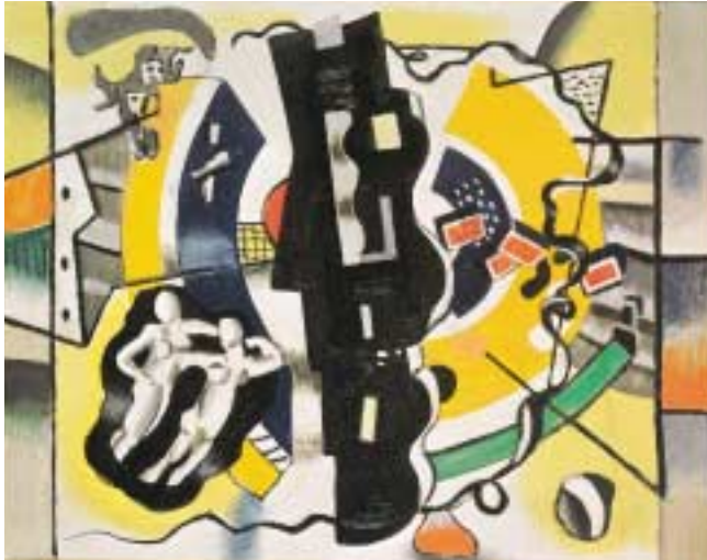
フェルナン・レジェ 《双子》 1929/30年 ルートヴィヒ美術館蔵

けでなく、茶色や灰色などの暗い色調を多用しているために、フォーヴィスムの絵画に比べて馴染みにくいかもかもしれません。しかしキュビズムによる西洋絵画の伝統 - すなわち遠近法を用いたイリュージョニスティックで自然主義的な絵画空間 - の放棄は、20世紀の絵画史上極めて画期的な出来事でした。このことは逆に、キュビズムこそが、一般に分かりにくいとされる20世紀絵画理解の入口となりうることを示しています。難解な抽象絵画を理解する第一歩として、ぜひキュビズムの作品に挑んでみてはいかがでしょうか。