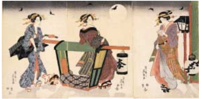
(図1)溪斎英泉《秋葉常夜燈》 文政5(1822)頃 千葉市美術館蔵

第1部「溪斎英泉」では旧今中コレクションの英泉作品から版画125点と版本14点、計139点を展示しています。大判三枚続の作品「秋葉常夜燈」(図1)は英泉が優れた作品を多く生み出していた文政5年(1822)頃の作品です。満月に照らされて三人の芸妓の影が地面に落ちるところは少し洋風というかモダンな印象を受けます。左端の芸妓の着物は秋を感じさせる薄の模様で、その帯は英泉が好んで描いた亀の模様です。版元上村与兵衛の「上むら」とその商標が提灯にも記されています。大判上下二枚続の「雲