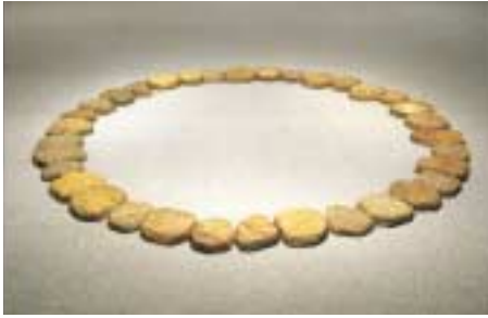
リチャード・ロング 《水石の輪》 1996年 寄託作品

「円」と聞いて思い浮かべるのは、永遠に続いてゆく穏やかな世界、それとも、見る人の目を惑わす力強い渦巻き模様でしょうか。本展では、円から連想される6つのイメージをめぐる様々な作品を紹介します。小中学生や美術館は初めてという方を主な対象とする展覧会です。