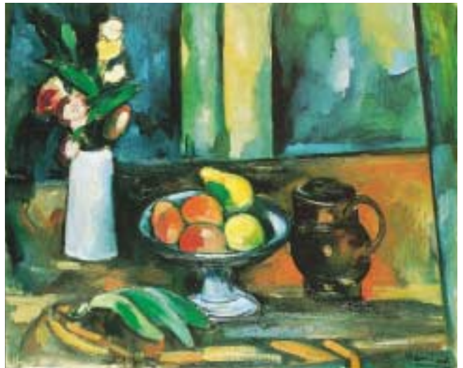
モーリス・ド・ヴラマンク 《花束と果物のある静物》 1911年 ルートヴィヒ美術館蔵

フォーヴィスムは、1905年頃に頂点を迎え、1909年頃までには事実上解体してしまいます。メンバーの多くもフォーヴ様式