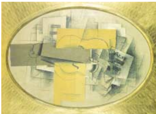
ジョルジュ・ブラック 《コップとヴァイオリンと楽譜》 1912年 ルートヴィヒ美術館蔵