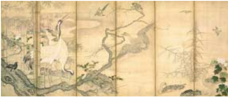
秋月等観《花鳥図屏風》室町時代

であってもいけない。結果として「質はいいが無名である作家」の作品は収集しにくいことになる。「駄作であるが有名な作家」の作品よりはるかに安いとしても、である。でもこれを続けられれば、また彼らのような素直な眼に先を越される可能性は多いに残されるだろう。今のところ、自分の眼だけを基準に、自在に美術品を集める喜びを堪能する彼らは、やはり選ばれた存在のように見える。