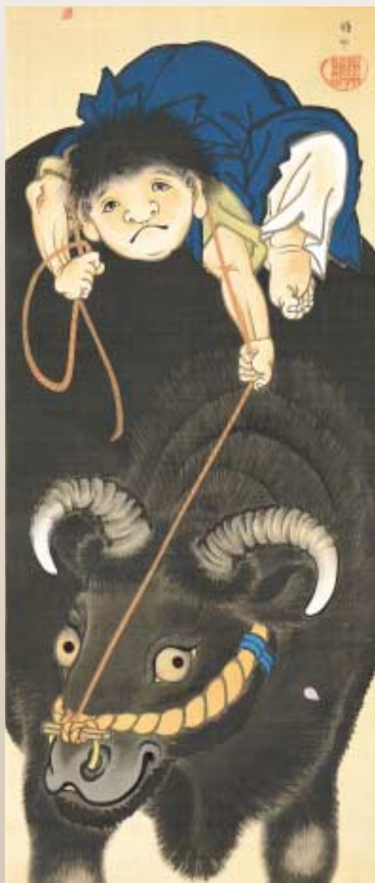
上田耕沖《牧童図》(部分) 江戸後期-明治時代