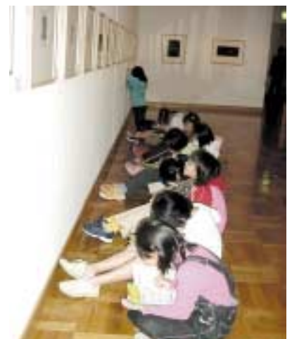
都小学校の5年生たちがあふれる展示室

以上のふたつのイベントに共通するのは、参加型・体験型であるということです。昨今美術館はこうした企画を求められる機会が多くなり、我々もあれやこれやと試行錯誤しているところなのです。ただしここで重要なのは、参加・体験それ自体ではなく、いかに参加・体験するかということでしょう。実際に手や体を動かさずとも、いきいきとした経験はできるはずですから。美術館は、その活動の核である展覧会を軸に、来館者が心のアンテナを研ぎ澄ますことのできるような、あるいは作家の手の感触をありありとたどることのできるような、頭と五感を心地よく刺激する場でありたいとつねに考えています。(ni)