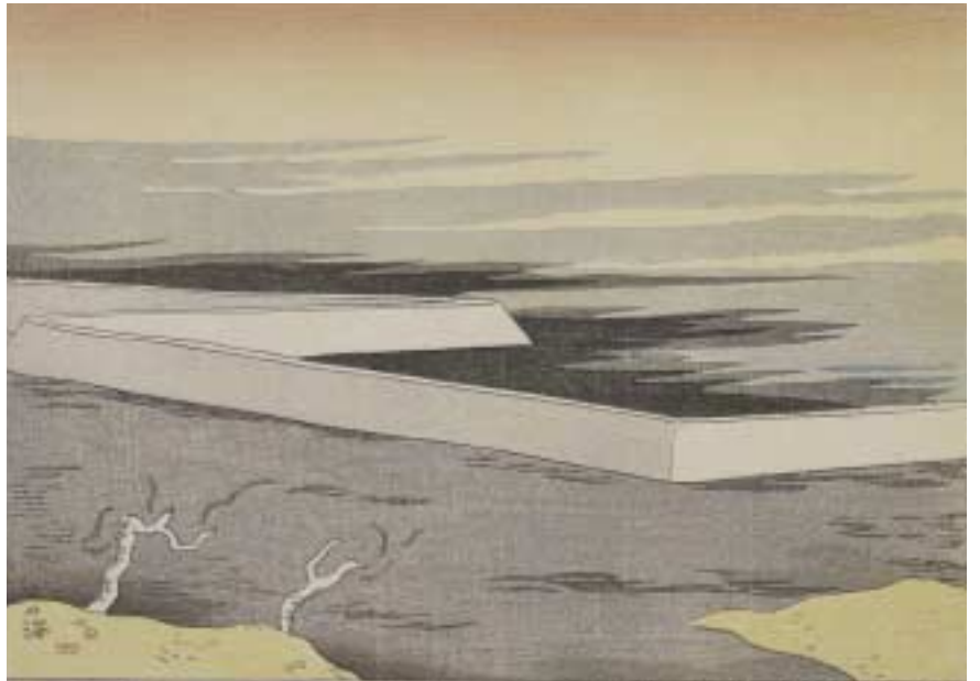
坂本繁二郎『日本風景版画第六集 筑紫之部』五「火の海」