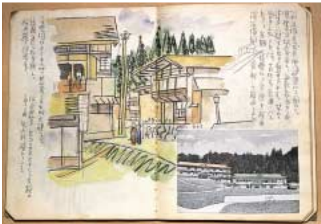
前川千帆『紀行スケッチ帖』

千葉市美術館のコレクションを全館展示で紹介する、冬期恒例の所蔵作品展を開催します。