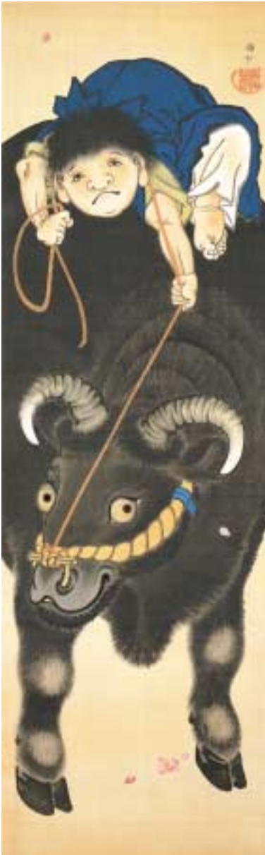
上田耕沖《牧童図》 江戸後期 明治時代