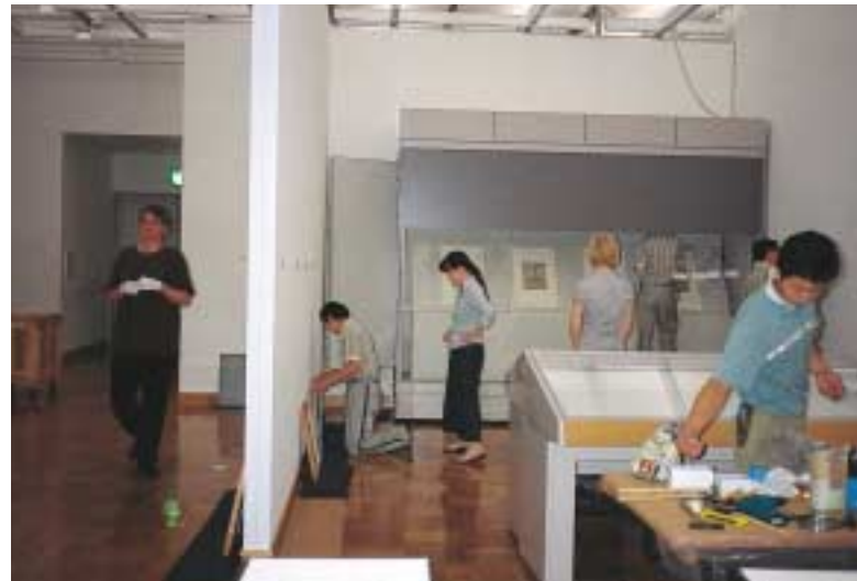
鈴木春信展展示作業 オープンの2日前