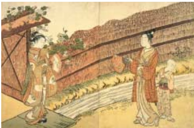
《見立夕顔》ホノルル美術館蔵