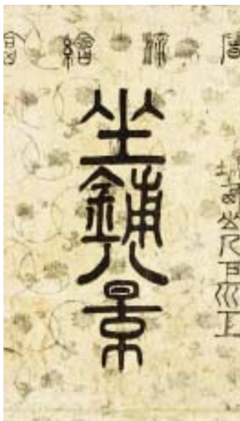
《坐鋪八景 包紙》シカゴ美術館蔵

深く巧まれた趣向は、時に幾重にも用意されていることもあるようである。その知的なトリックをどこまで読んでいいのか迷わされる場合もあるが、必ずや当時の鑑賞者も様々な頭をめぐらしたはずであり、絵師は当然それを予想していたはずである。ある程度の知識がなければ解くことができない趣向、あるいは教養人でさえ迷わせてしまう趣向、そうであればこそ春信の見立絵は魅力的なのである。