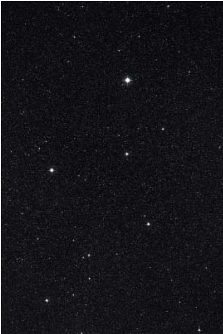
トーマス・ルフ 《星座 18h 20m / -65 °》 Thomas Ruff *18h 20m / -65 °