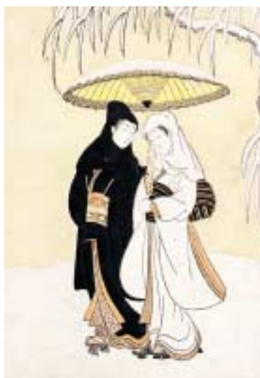
《雪中相合傘》メトロポリタン美術館蔵

年若い男女の恋の姿が、彼らの出逢いの瞬間やさりげないふれあいの様子が、鑑賞者の心さえ甘く透き通ったものにする。春信の繊細で優美な筆運び、見事な色彩感覚はそれら表現するのにふさわしく、男女の容姿は共に華奢で可憐であり、二人はまるで夢の中の住人であるかのように美しい。「雪中相合傘」は人々の心に最も深く記憶されてきた代表作である。