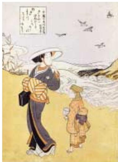
《六玉川 千鳥の玉川》メトロポリタン美術館蔵

春信には「思古人」という号がある。「古(いにしえ)を思う人」というその意味のとおり、春信の作品にはいにしえを思わせるところがある。江戸時代その当時のさりげない風俗のありさまを描いていても、たとえば平安時代の雅びやかさを感じさせる格調の高さがあり、古く和歌などに表されてきた日本人の季節感や恋心を現出するような気分がある。実際、春信の作品の多くが、絵の発想の契機を古典文学に求めているのである。