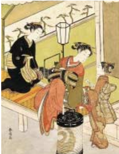
《浮世美人花見立 丁子屋内丁山 花王》シカゴ美術館蔵

明和5年(1768)頃より、春信は江戸で評判の町娘、吉原の遊女、また江戸名所など、江戸に実在の題材を作品に取り込むことが多くなっていく。