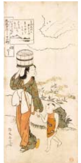
《風流やつし七小町 関寺》シカゴ美術館蔵

水絵(みずえ)と呼ばれているのは、輪郭線に墨を用いず、藍(露草)の青や紅といった色を中心に摺り出したやわらかな印象の版画である。古典や故事を題材にしたものが多く、水絵の効果も手伝って、閑雅な趣が伝えられる。高尚な好みを反映したこのような版画は、その版画の風合いからも、おそらくは明和期に入った直後に多く制作されたものであろうと考えられる。