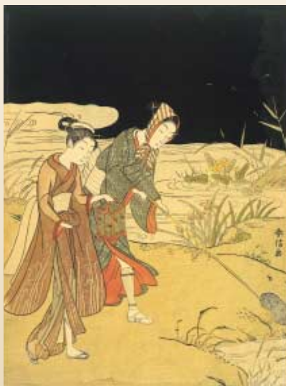
《蛭狩り》シカゴ美術館蔵