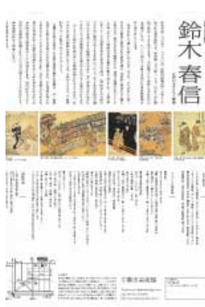
鈴木春信展ちらし表裏 デザイン：下田理恵

顔と手と下着の白、差し出す手燭のあかりの白、そして、展覧会を案内するすべての文字までもが、本来は夜の闇をあらわす黒のバックに白抜きで浮き出されているのです。