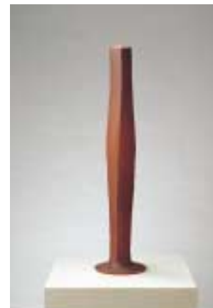
鈴木治《一本ノ木》 1988(平成10)年 土(泥象)