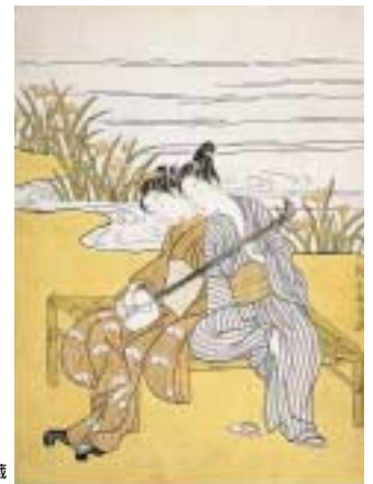
《三味線をひく男女》ミネアポリス美術館蔵