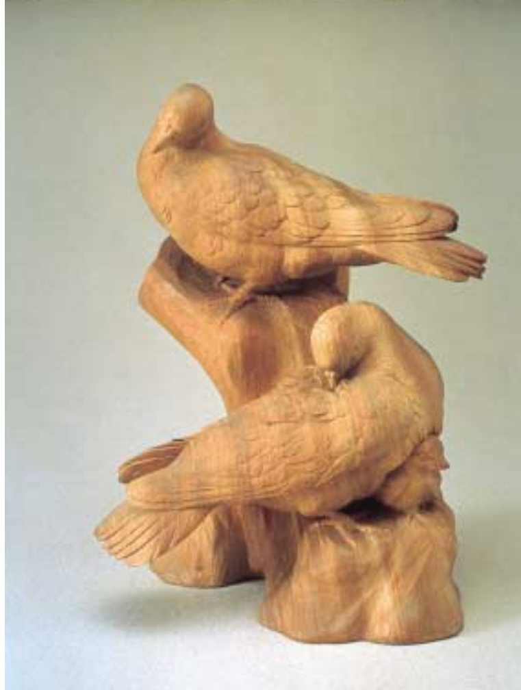
高村光雲《鳩》1926年 個人蔵