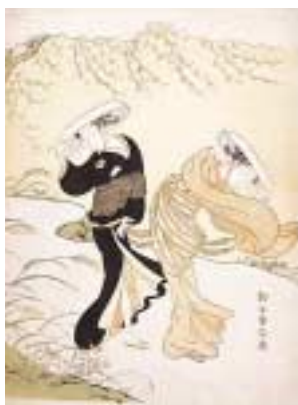
《秋の風》ボストン美術館蔵