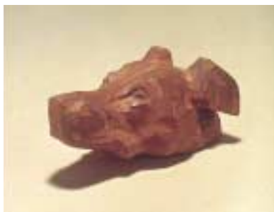
高村光雲《洋犬の首》1877年 個人蔵