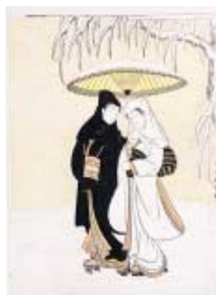
《雪中相合傘》メトロポリタン美術館蔵