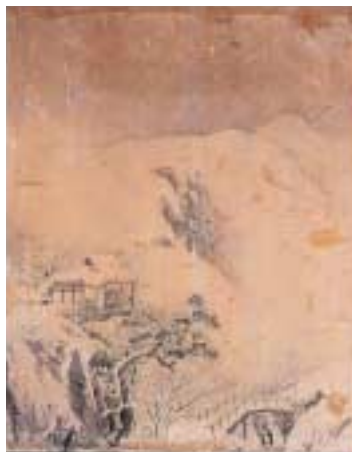
円山応挙《山水図襖》(部分) 旧円満院雪之間襖絵 明和期

また、展示室5では「現代の造形」と題し、近年収蔵したが公開する機会がなかった絵画、立体作品、写真作品などを展示します。立体的作品としては鈴木治「一本ノ木」、土谷武「SR24の試み」、そして写真を使うドイツのアーティスト、トーマス・シュトゥールートの「Strasse」(街路)、若林奮の版画「Underwood」などを展示する予定です。(i)