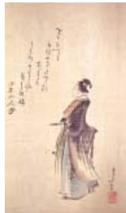
『蜀山人図巻名蹟集』より 葛飾北斎「若家図」 享和・文化年間

平成7年11月に開館した千葉市美術館の所蔵作品の収集は、平成2年度から本格的に開始されており、「千葉市を中心とした房総ゆかりの美術」「日本美術の核を形成する近世以降の美術」「現代美術」の3つの基本方針に沿って活動を続けてまいりました。この展覧会では、平成13年度に新たに収集した作品のなかから、第一弾として、御寄贈を受けた鈴木コレクションの屏風絵を中心に、41件の作品を展示公開いたします。併せて、今回初の趣向として、「8つのいとなみ」と題し、収集活動をめぐるさまざまな局面の一部をご紹介しますこととしました。作品の数だけ収集をめぐる物語が紡がれ蓄積されて今日の美術館活動を支える力となっています。「1.受贈」「2.揃える」「3.補完する」「4.新しいコレクションを」「5.千葉市美術館だけの・・・」「6.発見する」「7.展覧会がとりもつ縁」「8.手から手へ」という8つのエピソードを通じ、このたび千葉市美術館のコレクションに加わることとなった作品が、これまでたどってきた道筋にも思いを馳せつつご鑑賞お楽しみいただければ幸いです。8階展示室で開催します。(ma)