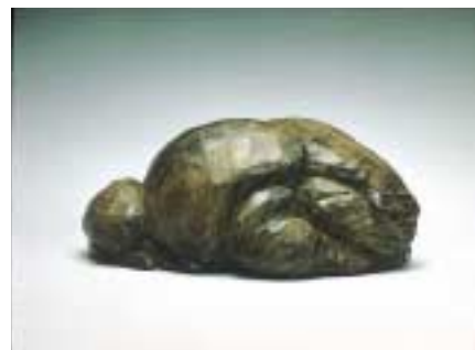
佐藤朝山《冬眠》1928年 個人蔵