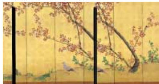
森徹山《春秋花鳥図屏風》鈴木民三氏寄贈