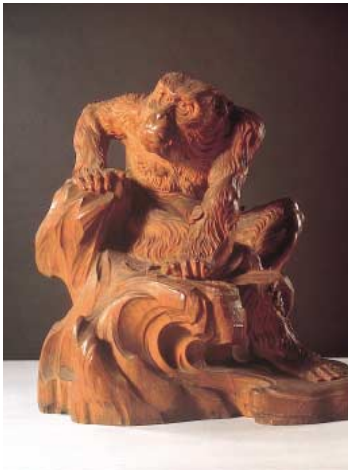
高村光雲《老猿》1893年 東京国立博物館蔵