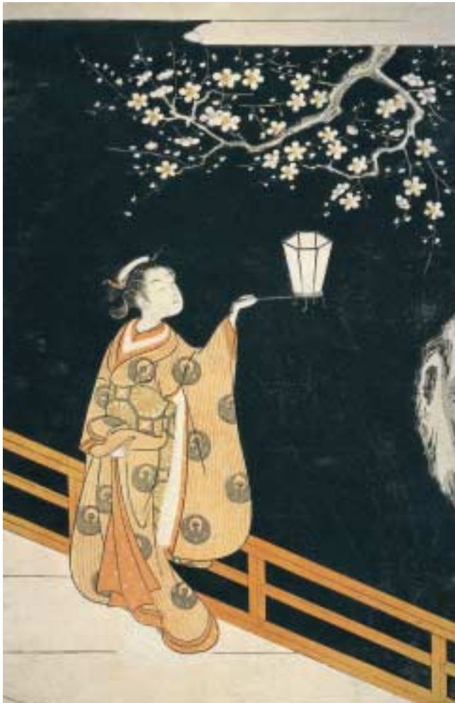
《夜の梅》メトロポリタン美術館蔵

再三お知らせしている通り、今秋の特別展は、いよいよ待望の鈴木春信。屈指の企画力を誇る千葉市美術館が開催する世界から期待を集めている展覧会です。詳細は次号にまかせますが、担当の学芸員は目下最後の交渉や印刷物の準備に余念がありません。