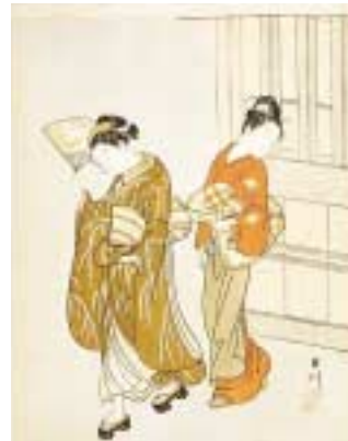
《坐鋪八景 扇晴嵐》シカゴ美術館蔵

再三お知らせしている通り、今秋の特別展は、いよいよ待望の鈴木春信。屈指の企画力を誇る千葉市美術館が開催する世界から期待を集めている展覧会です。詳細は次号にまかせますが、担当の学芸員は目下最後の交渉や印刷物の準備に余念がありません。